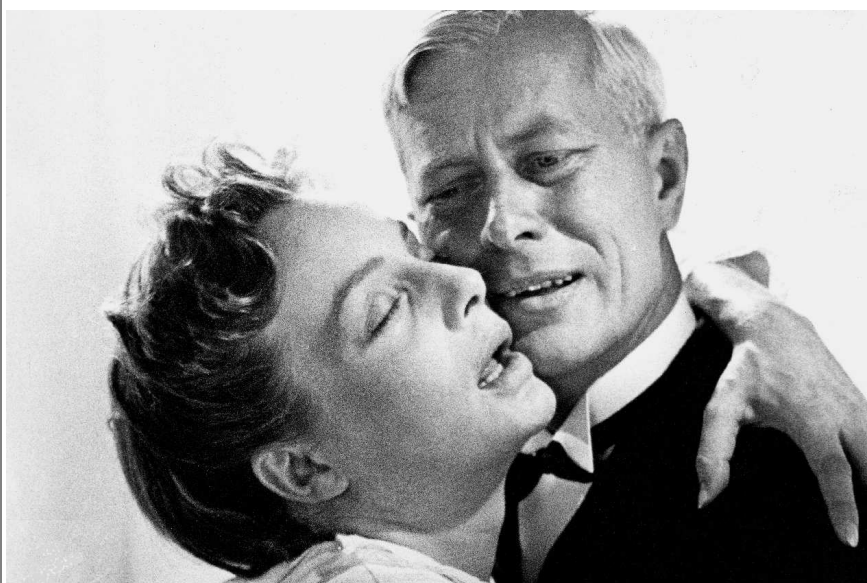
Ordet (la Parole), un chef-d'oeuvre de Carl-Th. Dreyer

film & spiritualité : association loi 1901