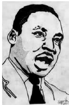
Martin Luther King